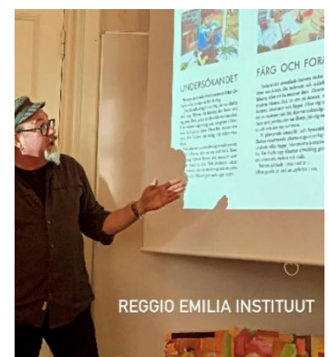
REGGIO EMILIA INSTITUUT