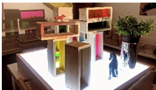
WERKEN MET VERSCHILLENDE MATERIALEN