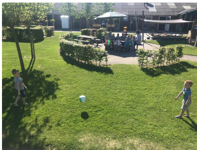
Kinderdagverblijf 't Belhameltje